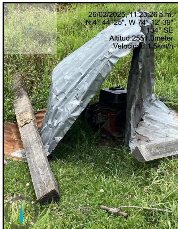
Ilustración 4. Motobomba en la ronda del Humedal Gualí

En la visita técnica ambiental no fue posible confirmar si la captación contaba con los permisos ambientales otorgados por la Corporación Autónoma Regional de Cundinamarca- CAR, por lo tanto, es necesario realizar la consulta con dicha autoridad.