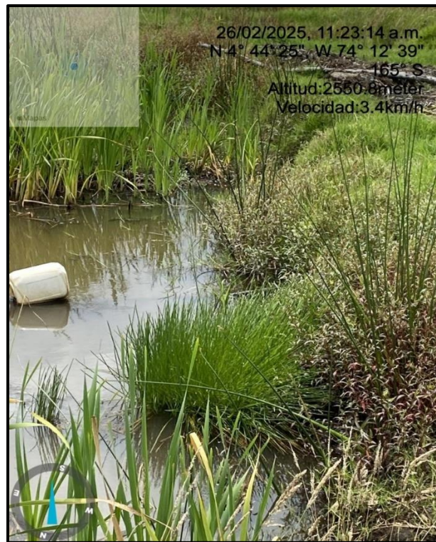
Ilustración 5. Manguera en la ronda del Humedal Gualí

C.P. 250020 Tel. +57(1) 823 40 70 823 40 71 / 823 40 73 Fax. + 57(1) 825 76 20 Dir. Cra. 14 No. 13-05