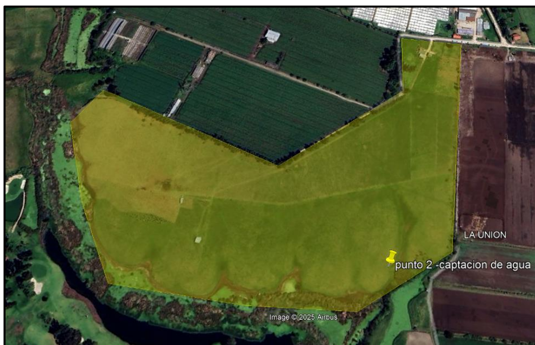
Ilustración 2. Ubicación del predio

Durante el recorrido de control y vigilancia en el punto 2 se evidenció una captación de agua superficial en el Humedal Gualí en el predio denominado “La Mitaca” (Ilustración 2. polígono amarillo), como se muestra en la siguiente ilustración: